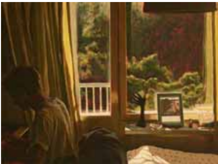
"Klaviatur", 71x93 cm