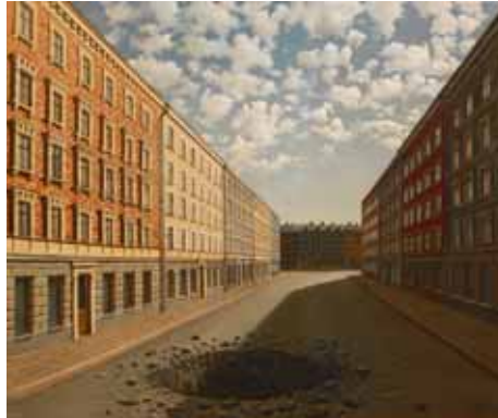
"Stadsbild II", olja på duk 82x99 cm