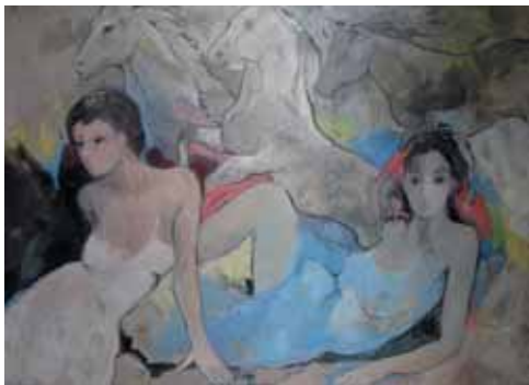
"Tota una bella eternitat", olja på duk, 100x130 cm