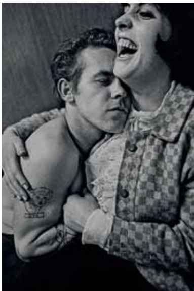
"Café Lehmitz" , 1970, 40x30 cm