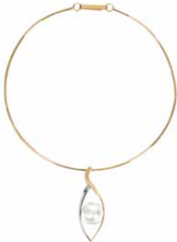
Halsring guld/vitguld med odlad pärla