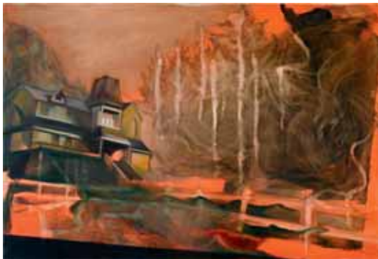
'Salem's Lot', 75x120 cm, olja på duk