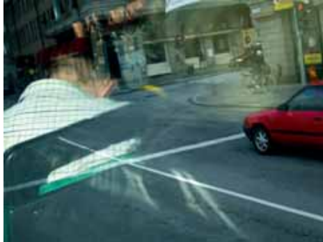
"Malmö 2008", 21x28 cm