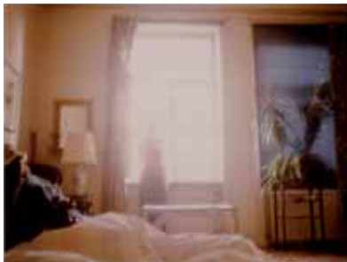
"Interiör", 60-talet, 30x40 cm