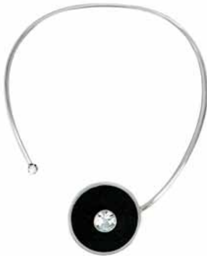
Halssmycke, silver/lava /bergskristall