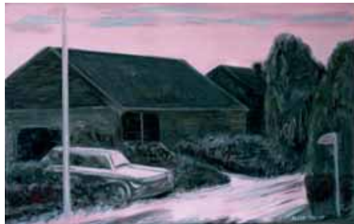
"Kl 5 på eftermiddagen", olja på duk, 57x88 cm

Någon sa nyligen till mig att mina bilder såg 'hemliga' ut. När jag granskar vad jag gjort hittills, ligger det mycket i påståendet, inte minst när jag tänker på vad som styrtt motivval och bildkomponerande; en fascination inför det obegripliga och 'hemliga' som ständigt omger oss i vardagen.