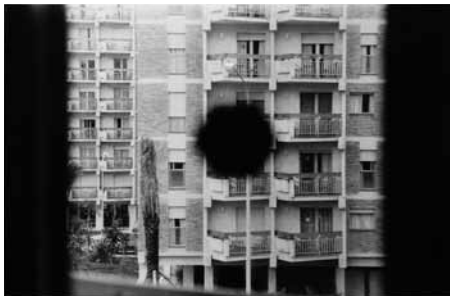
Benalmádena Spanien, 1973, 33 x 50 cm