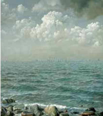
"Sundet", olja på duk, 99x89 cm