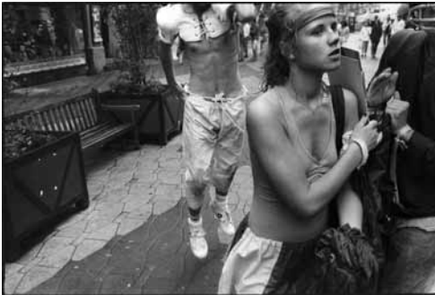
"Malmö 1983", 24x36 cm