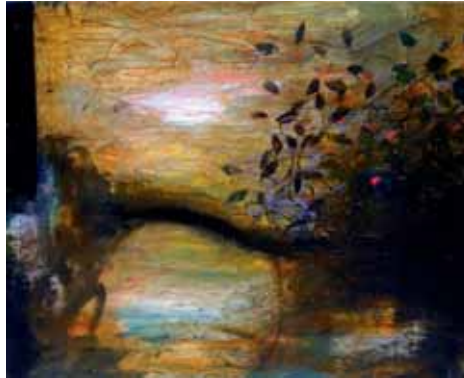
"Med buskage", 31x39 cm, olja på duk