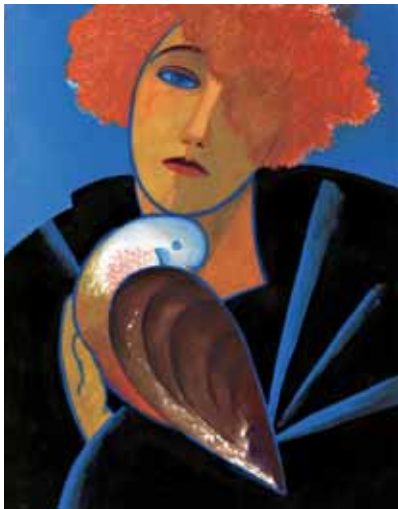
"Flickan och fågeln II", gouache på papper, 34x27 cm