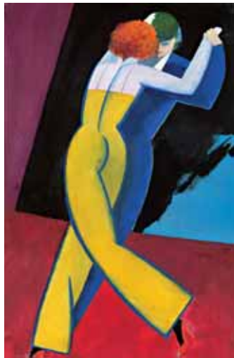
"Dans" gouache på papper, 38x25 cm