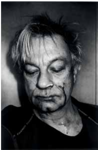
"Självporträtt" , 2006, 40x30 cm