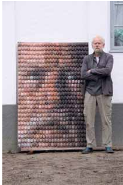
'Nyllen', rakubränd lera

Även om hennes målningar av stillbilder ur skräckfilmer på intet sätt är otäcka, känns de mystiska, som om betraktaren bevittnar något man inte borde se.