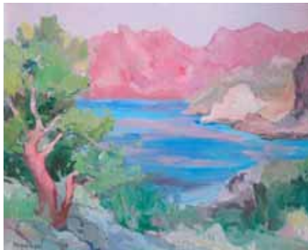
"Cala Sant Vicente", olja på duk, 50x60 cm